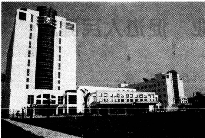
图为江苏省卫生妇幼保健中心

医学科研体系。省原子医学研究所建成了核医学国家重点实验室。全省建立了心脏内科、内分泌科、血液科、神经外科、矫形外科等一批省级重点临床专科,其技术水平保持国内先进或领先水平,成为我省专科新技术研究开发、人才培养和技术指导中心。1978年以来,全省取得了一批有重要价值的科技成果,在许多研究领域处于国内先进水平。医学教育发展迅速,全省现有高等医药院校10所,普通中等卫